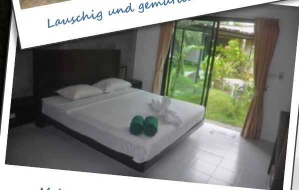
Mein Platz – auch für Zwei ! :)