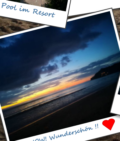
WOW! Wunderschön !! ❤️