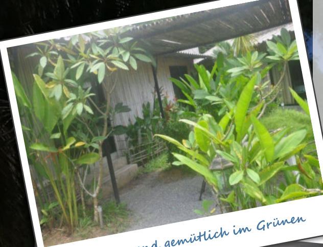
Lauschig und gemütlich im Grünen