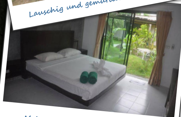
Mein Platz – auch für Zwei ! :)