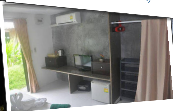
Alles da, was ich brauche :)