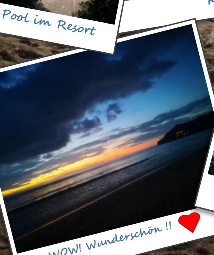
WOW! Wunderschön !! ❤️